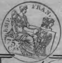
Table alphabétique des actes des Décès de la Mairie de Viersen pour l'an Neuf, dressée en exécution du Décret impérial du 20 juillet 1807