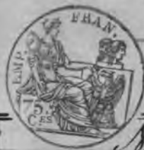
Table alphabétique des actes des Décès de la Mairie de Weisen pour l'an Huit dressée en exécution du Décret impérial du 20 juillet 1807.