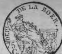
TABLE ALPHABÉTIQUE des Actes de décès de la mairie de Wissen pour l'an 1812 dressé en exécution du décret impérial du 20 juillet 1807.