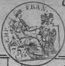
Table Alphabétique des actes des Déces de la Mairie de Dieffen pour l'an 1807 dressée en exécution du Décret impérial du 20 juillet 1807.