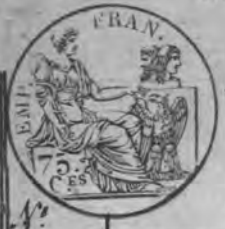
Table alphabétique des Actes des Décès de la Mairie de Weisen pour l'an 14 & 1806 dressée en exécution d'un Décret impérial du 20 juillet 1807.