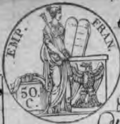
Table alphabétique des actes des Décs de la Mairie de Vierzen pour l'an ouve, Dressée en Exécution du Décret impérial du 20 juillet 1807.